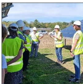
Visiteurs avec leurs guides