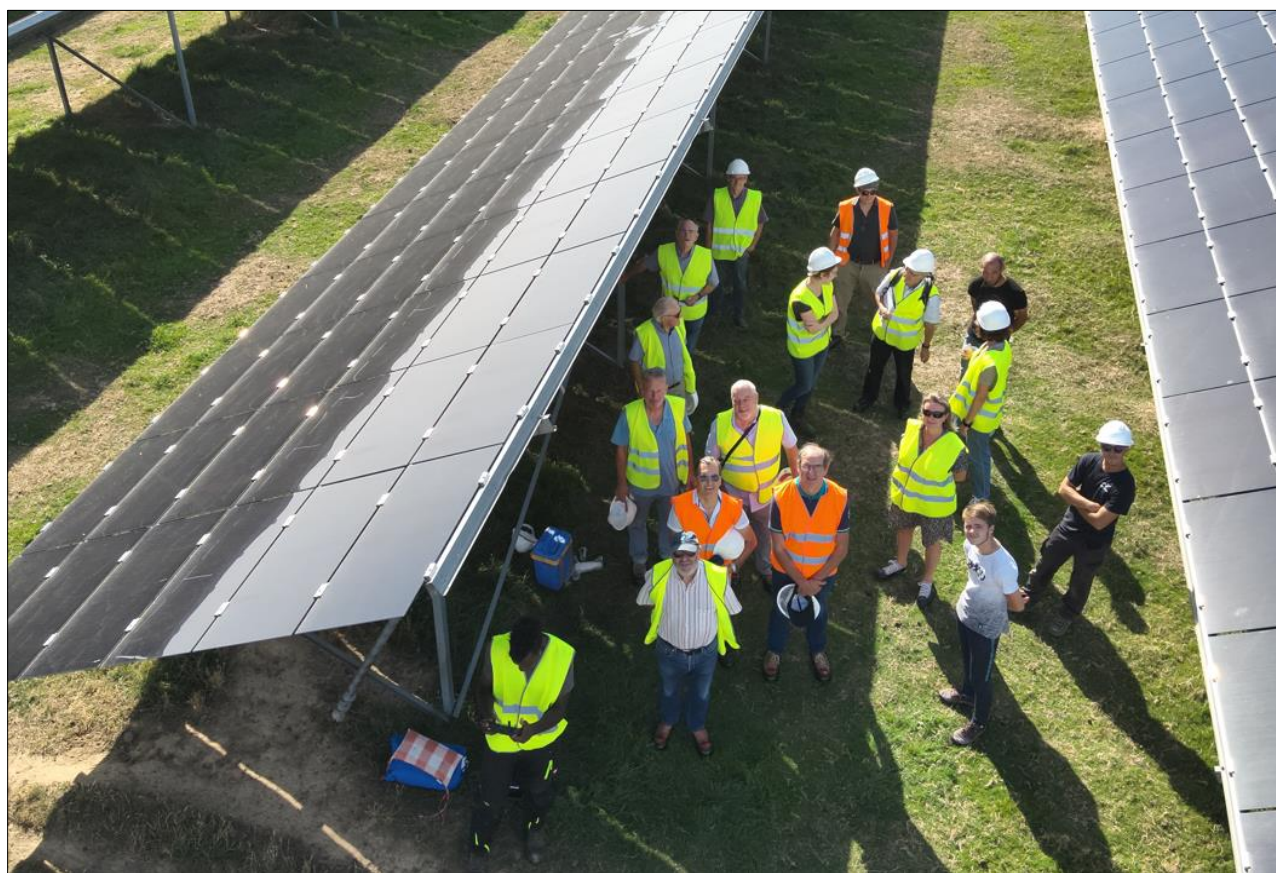
Les participants photographiés au moyen du drone