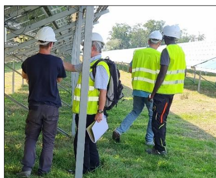
Des échanges en toute transparence

Au-delà du rôle de la Chambre d'Agriculture au niveau du territoire, cette journée permettait de comprendre, et dans quelles conditions, l'énergie photovoltaïque trouve sa place dans les exploitations agricoles du département.