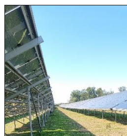
Les panneaux sur une ancienne pâture désormais dédiée aux ovins